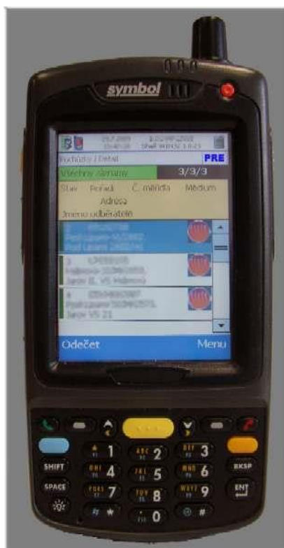
(Obr. 3 – Terminál)